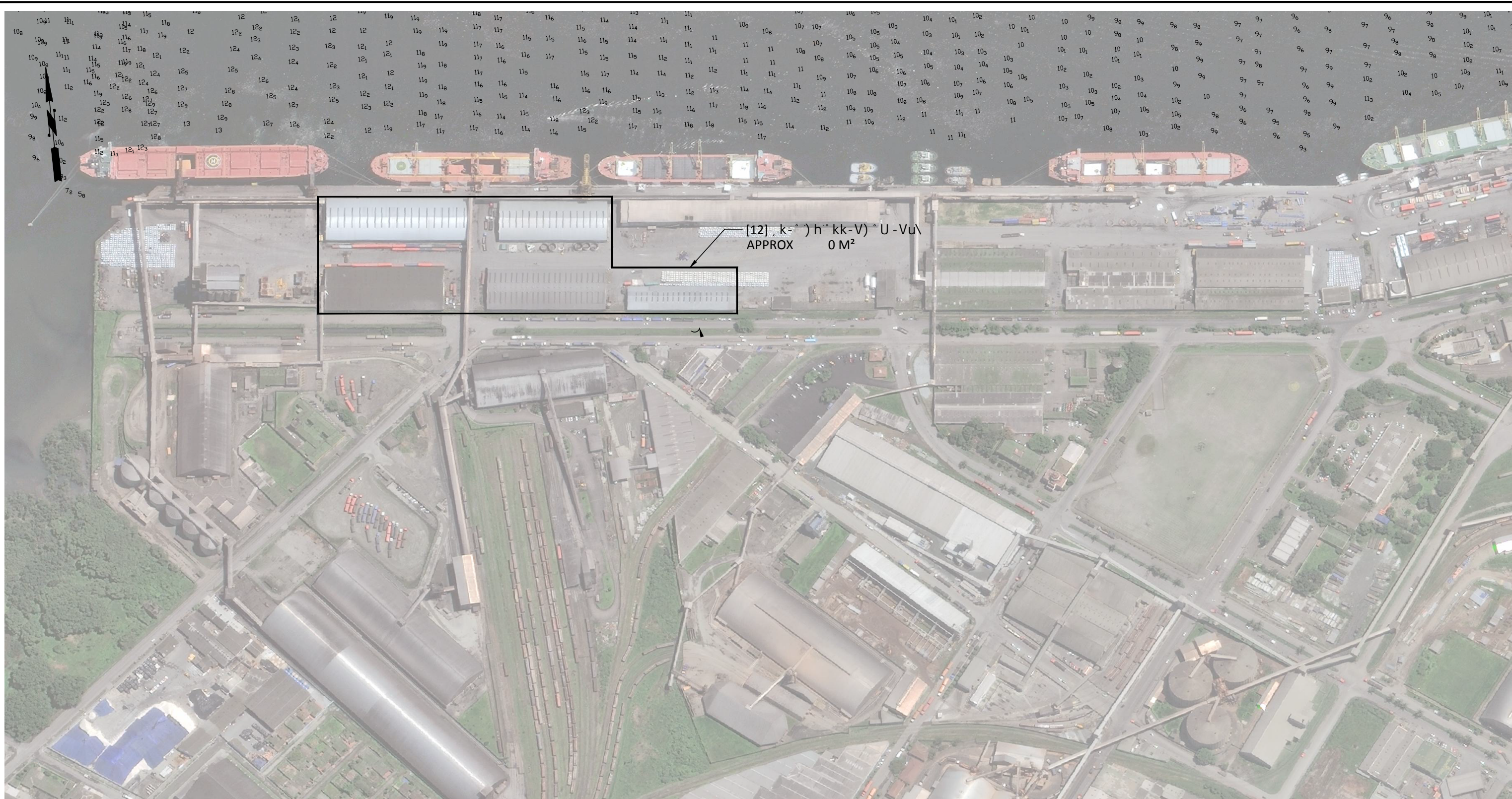
PLAN - PAR01 # \ Vu\ kv\ ) ° : k- ° SCALE: 1:1750 35 0 35 70 scale meTers